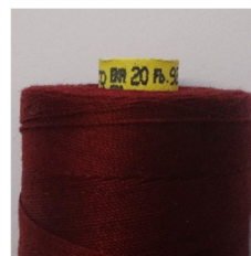
Baumwollgarn mit Stärke 20