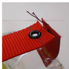
Verschluss mit zwei Knoten