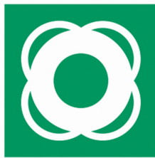
ISO Zeichen Rettungsmittel