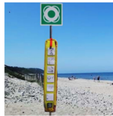
Montagemöglichkeit auf Pfosten am Strand